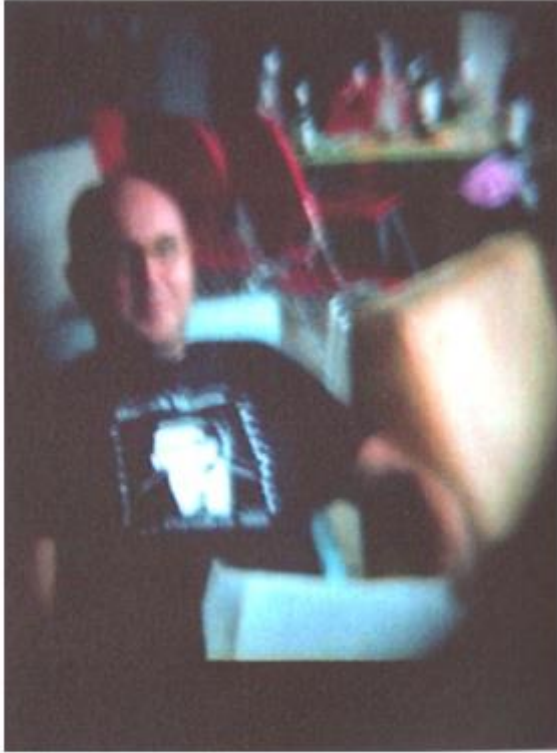
Cantante Waldick Soriano

Las notas explicativas que acompañan la imagen nos permiten develar una analogía entre relato y fotografía. Sin embargo, esta relación es muchas veces irrisoria, ya que no sabemos si las fotografías juegan un papel de verosimilitud documental o más bien son una nueva forma de leer el relato. Este juego de extrañeza se comprueba con el ejemplo anteriormente mencionado. El cantante popular brasileño es fundamental en la novela, ya que es uno de los favoritos de la declamadora de canciones, madre del protagonista. Y su foto aparece con el referente de las notas explicativas. Por supuesto que el cantante existe, sin embargo, no es el mismo al que se menciona en la novela. Por lo tanto, dicha imagen nos devela que las fotografías en la obra de Bellatín Los fantasmas del masajista no cumplen una función de verosimilitud documental, sino más bien constituyen una nueva forma de leer la novela, a partir del punctum y los modos de ver, tanto del lector como del autor.