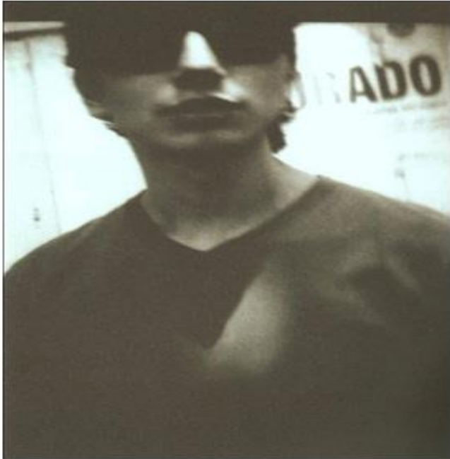
Joven que asesinó a su tatarabuela dentro de una canción popular