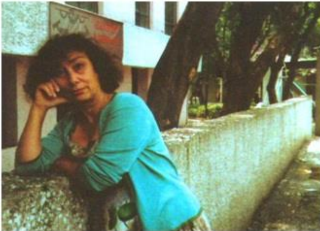
Una de las mujeres de edad madura que acostumbran a acudir vestidas de muchachas a las fiestas populares

Otro elemento que nos permite vislumbrar el carácter ficcional de la fotografía es la premisa de que la verdad de la imagen no se corresponde necesariamente con aquello que vemos o creemos ver. Las series fotográficas de la novela nos hacen dudar sobre la realidad. No sabemos si lo que está expuesto en las fotografías tiene una relación verdadera con la realidad. Aunque se mencionen cantantes contemporáneos existentes: Waldick Soriano, Chico Warken, etc., espacios reales como Sao Paulo, parques. No sabemos con exactitud si se corresponden con la realidad. El hombre que aparece en la fotografía número veinte: Waldick Soriano, no es el cantante popular es otra persona. Por qué razón el autor lo fotografió, no lo sabemos. En la fotografía número diecinueve titulada Una de las mujeres de edad madura que acostumbran acudir vestidas de muchachas a fiestas populares , tampoco sabemos si es en realidad una de las mujeres descritas en la narración. Lo único que sabemos entonces es que la fotografía si juega el papel de ficcionalidad. Por lo tanto, el rol de las series fotográficas no es sólo de analogía ni de verosimilitud, sino más bien la función de re-significar la narración. Ya que todos los elementos anexos, los encuadres, las técnicas utilizadas son posibles modos de ver del autor-fotógrafo, potenciando de esta forma, los posibles modos de ver del lector-espectador.